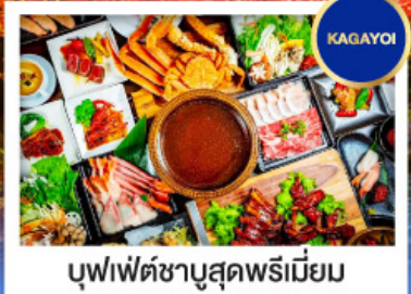
บุฟเฟ่ต์ซาบุดะพรีเมียม