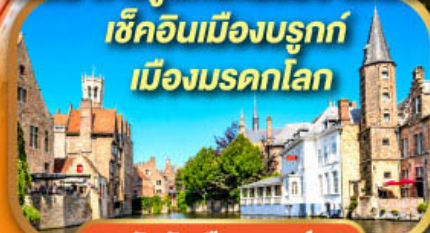
จัตุรัสเมืองบรูคซ์