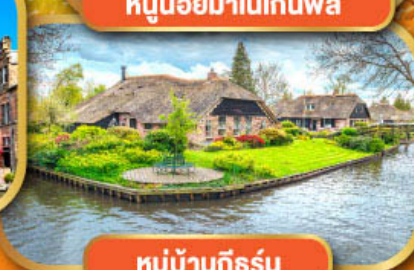
หมู่บ้านก็ธูร์น