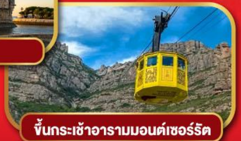
ขึ้นกระเช้าอารามมอนต์เซอร์ริต