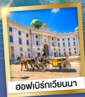
ออฟบิร์กเวียนนา