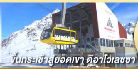
ขึ้นกระเช้าสู่ออดเขา ดือาไวเลชซา