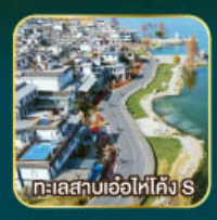
ทะเลสาบเอ๋อไห่โค้ง S