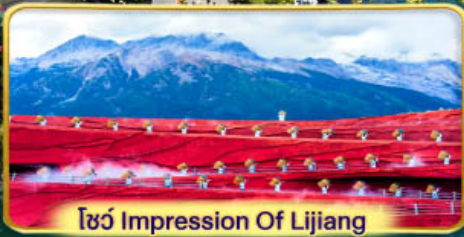
โชว์ Impression Of Lijiang