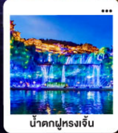
น้ำตกฝูหลงเจิน

"มหัศจรรย์...จางเจียเจีย" | ดินแดนแห่งขุนเขาและสายน้ำ "เขาเกียนเหมินซาน" | ประตูล่องเรือ...ทำกายกรรม 999 ชั้น | นั่งรถไฟความเร็วสูง สัมผัสความสวยงามระบือขงแกว "อุทยานอวตาร" | ล่องลอยกลางขุนเขา...ดั่งภาพฝันในห้วงเวียงเจียเจีย | ช้อปปิ้ง POPMART "เมืองโบราณ"ฝูหลง" หยุคเวลา ณ เมืองบนม่านน้ำตก... | "เฟิ่งหวง" ล่องเรือชมชีวิตริมแม่น้ำกิวเจียง "นครฉางซา" ปิดท้ายความทันสมัย