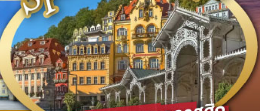
ชมสถาปัตยกรรมคลาสสิก เมือง คาร์โลวี วารี