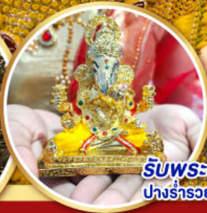
รับพระพิฆเนศ ปางรำรอย ท่านละ 1 องค์