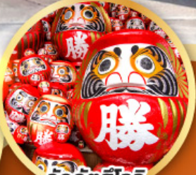
วัดคิตสึโองิ (วัดดามะ)

ชมความงามของกำแพงหิมะ เส้นทางสายอัลไพน์ ทาคายามา (JAPAN ALPS SNOW WALL)