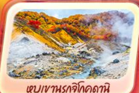
เขมเขานรชจิโกดากะนิ