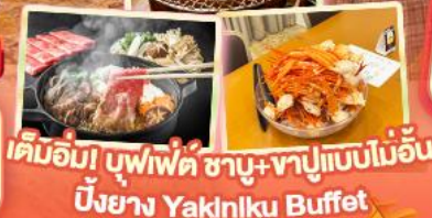
เด็มอิมิ บุฟเฟ่ต์ ซาบู+ซาบูแบบไม่อั้น ปิ้งย่าง Yakniku Buffet

✈️ สายการบิน AirAsia X (XJ) น้ำหนักกระเป๋า 20 KG