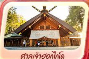
ศาลเจ้าซอกโกโต