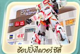
ช้อปปิ้งโตเวอร์ ซิตี้

ชมวิวภูเขาไฟฟูจิ สวนโออิชิ หมู่บ้านน้ำใสชิโนะ อักโก เยือนวัดเซ็นโซจิ อาซากุสะ ตลาดปลา Toyosu ช้อปปิ้งของที่ห้างดัง โตเวอร์ ซิตี้