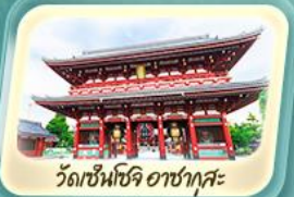
วัดเซ็นโซจิ อาซากุสะ

24-27 เม.ย.68 / 15-18 พ.ค.68 / 22-25 พ.ค.68 / 29 พ.ค. - 1 มิ.ย.68 31 พ.ค. - 3 มิ.ย.68 / 12-15 มิ.ย.68 / 28 มิ.ย. - 1 ก.ค.68