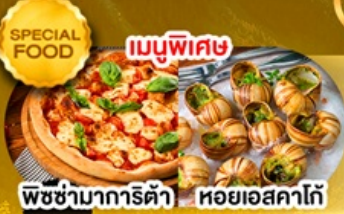
พิซซ่ามาการิตต้า หอยยอสคาโก้