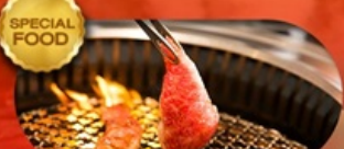
อาหารมือพิเศษ ปิ้งย่างยากิniku