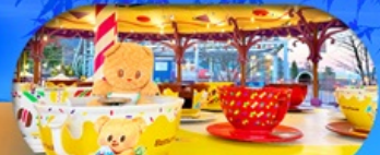
Fuji q Highland x Butterbear เดินทาง พ.ศ. 69 เป็นต้นไป