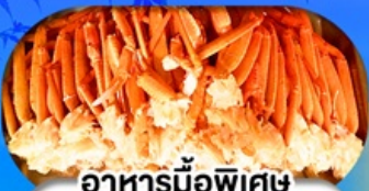
อาหารมือพิเศษ บุฟเฟ่ต์ขาปู