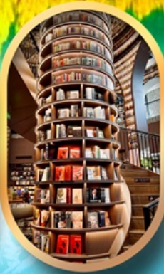
ร้านขายหนังสือ