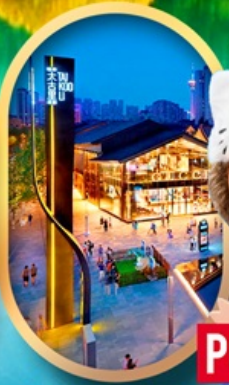
ถนนคนเดินไท่กู่หลี่