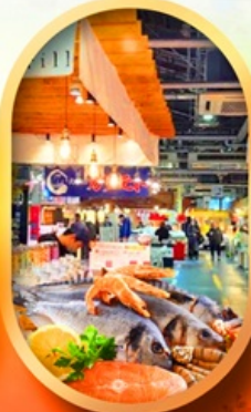
ตลาดปลานิวโอกะ