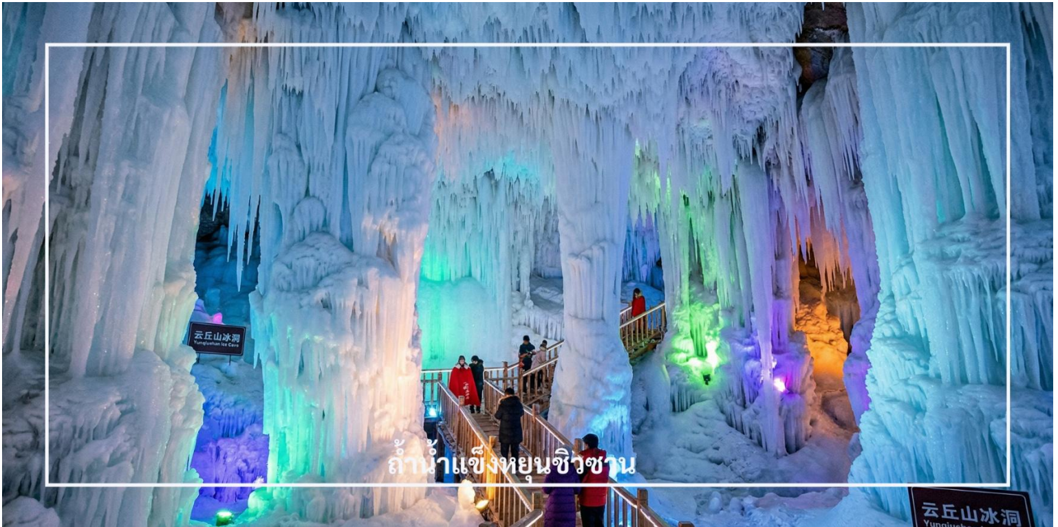
ถ้ำน้ำแข็งหยุนชิวซาน

รูปทรงแปลกตา เปลี่ยนประกายสวยงามภายใต้แสงไฟหลากสี บรรยากาศภายในให้ความรู้สึกราวกับอยู่ในโลกอีกใบ พร้อมอุณหภูมิที่เย็นจัดติดลบตลอดทั้งปี แม้ในช่วงฤดูร้อน ให้ท่านได้เดินชมและเก็บภาพความสวยงามของธรรมชาติที่หาได้ยากแห่งนี้