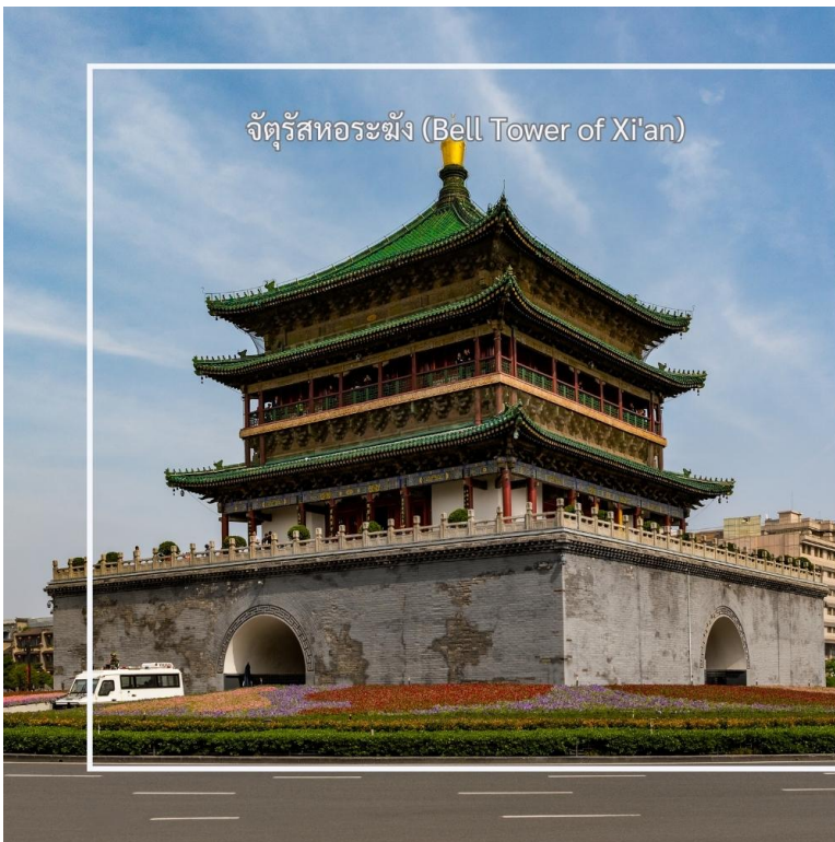
จัตุรัสหอรฆัง (Bell Tower of Xi'an)

จากนั้นนำท่าน ผ่านชมจัตุรัสหอกลองและหอรฆังซีอาน (Xi'an Drum & Bell Tower) แลนด์มาร์คสำคัญที่ตั้งอยู่ใจกลางเมืองซีอาน และถือเป็นสัญลักษณ์ทางประวัติศาสตร์ของเมืองหอรฆังและหอกลองสร้างขึ้นในสมัยโบราณ เพื่อใช้บอกเวลาและส่งสัญญาณเตือนภัยให้กับผู้คนภายในเมือง โดยในอดีตจะตีระฆังในช่วงเช้า และตีกลองในช่วงค่ำ จนได้รับการขนานนามว่าเป็น “ระฆังรุ่งอรุณ กลองยามค่ำ” ปัจจุบันสถานที่แห่งนี้ยังคงได้รับการอนุรักษ์ไว้อย่างดี และเป็นอีกหนึ่งจุดสำคัญที่นักท่องเที่ยวนิยมมาเก็บภาพบรรยากาศใจกลางเมืองซีอาน