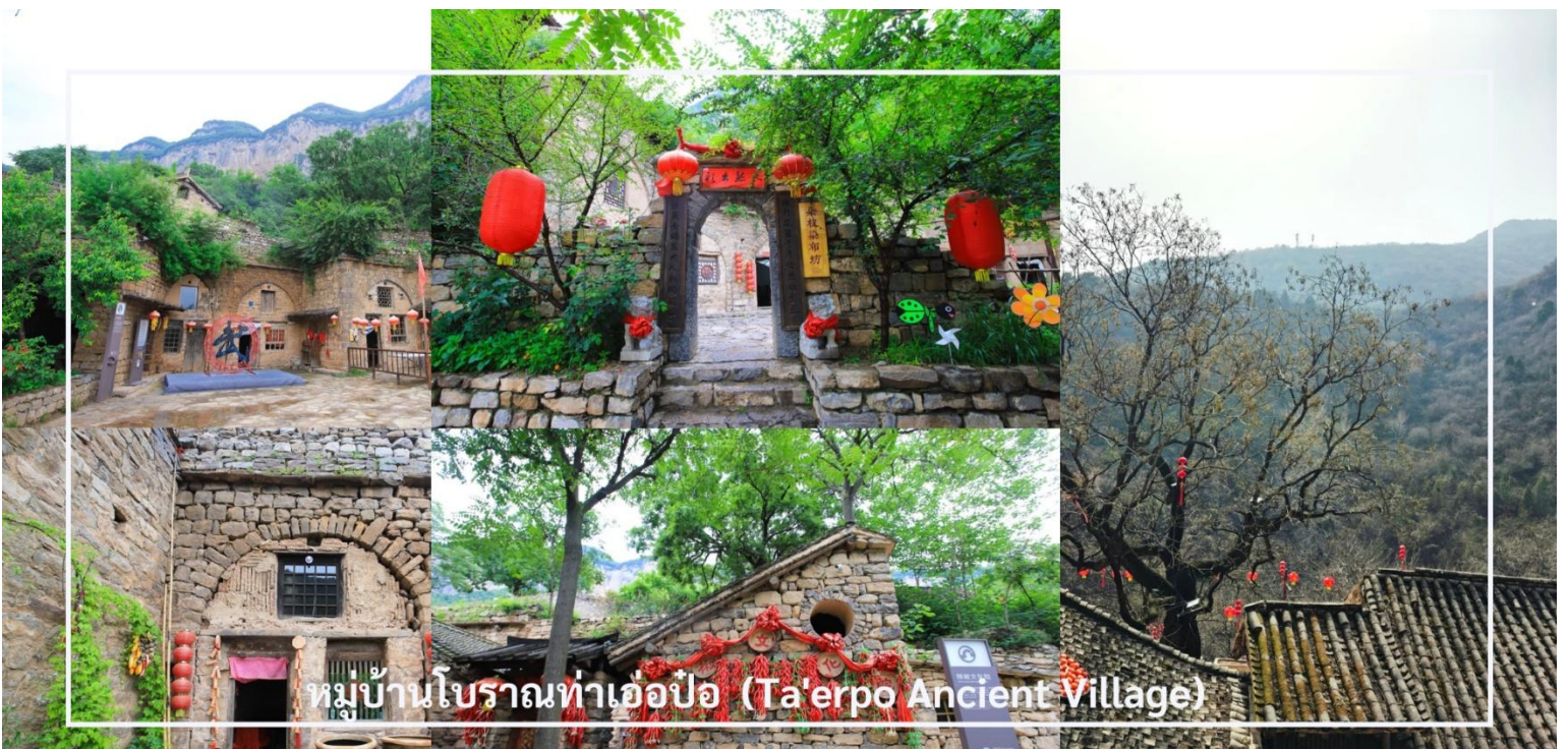
หมู่บ้านโบราณท่าเอ๋อเป้อ (Ta'erpo Ancient Village)

อิสระให้ท่านเดินชมถนนหินภายในหมู่บ้าน ชมบ้านเก่าแก่ที่ยังคงเอกลักษณ์แบบดั้งเดิม แวะถ่ายภาพตามมุมต่าง ๆ และลองชิมขนมพื้นเมืองที่ทำสดใหม่ เช่น เต้าฮู้ร้อน ๆ รวมถึงแวะถ่ายรูปกับประตูดินโบราณ ซึ่งเป็นอีกหนึ่งมุมสวยของหมู่บ้านแห่งนี้