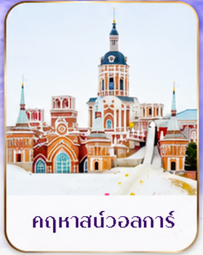
เทศกาลแกะสลักน้ำแข็ง Harbin Ice and Snow Festival