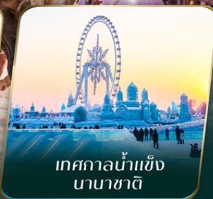
เทศกาลน้ำแข็ง นานาชาติ