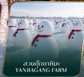
สวนตุ๊กตาหิมะ YANJIAGANG FARM