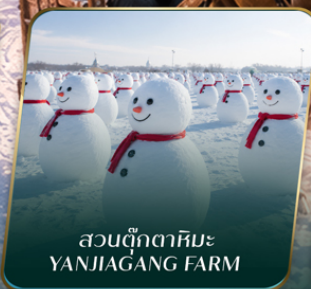
สวนตุ๊กตาหิมะ YANJIAGANG FARM