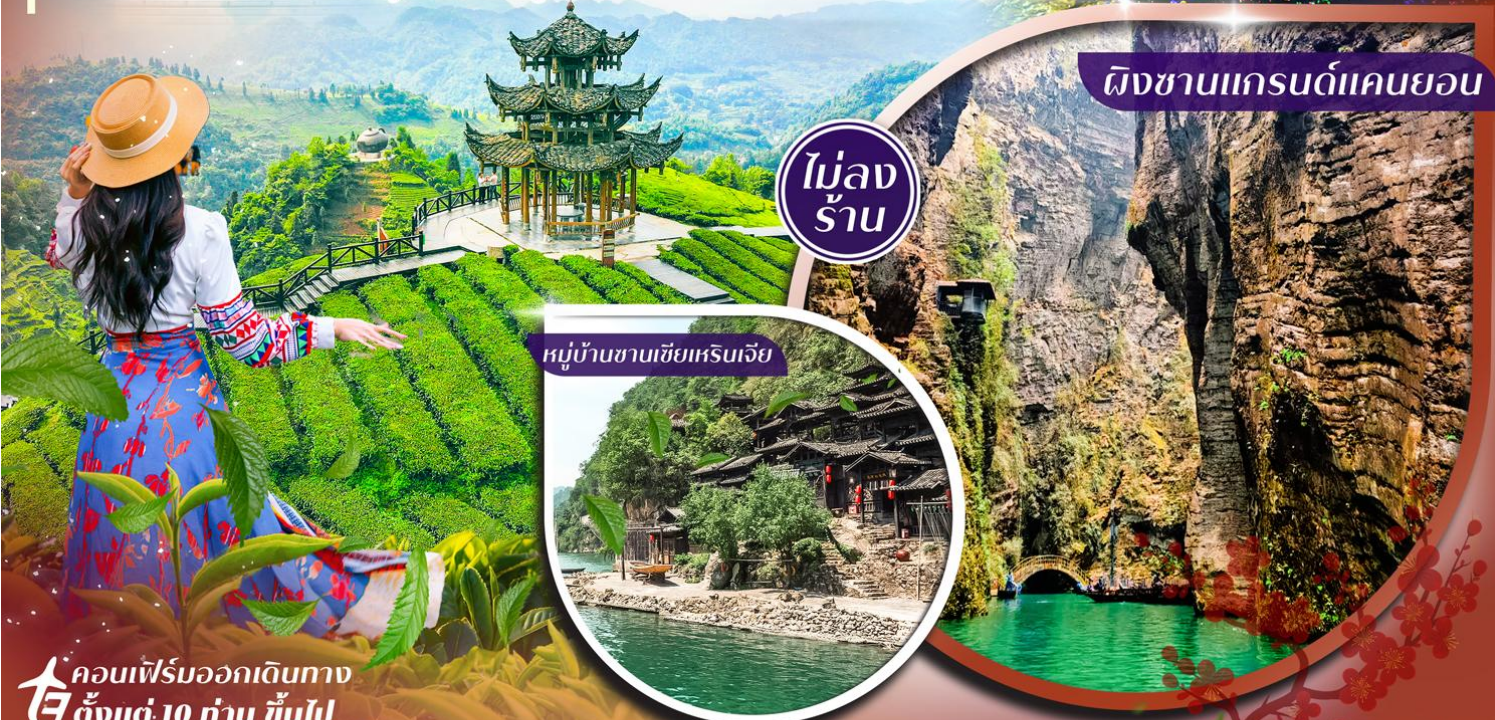
ผิงชานแกรนด์แคนยอน