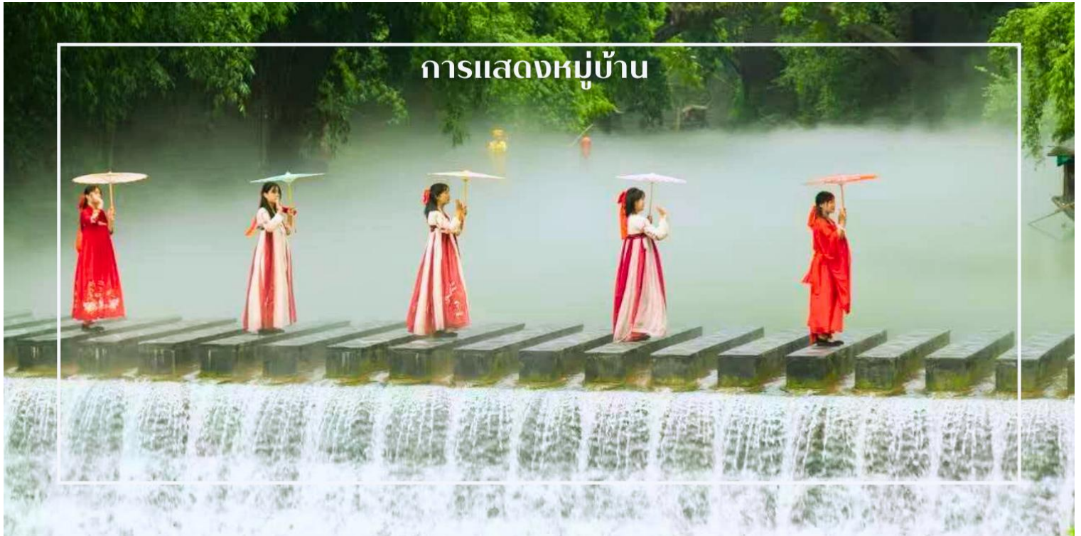
การแสดงหมู่บ้าน

นำท่านสู่ หมู่บ้านซานเซียเหรินเจีย (Sanxia Renjia) (รวมล่องเรือ) สถานที่นี้เป็นที่รู้จักกันในชื่อ หมู่บ้านสามผา แหล่งท่องเที่ยวระดับ 5A ตั้งอยู่ในเขตหุบเขาสามผา ริมน้ำแยงซีเกียง โดดเด่นด้วยทัศนียภาพทางธรรมชาติอันงดงามของภูเขาหินผา สายน้ำ และหุบเขาที่โอบล้อมกันอย่างกลมกลืน สถานที่แห่งนี้สะท้อนวิถีชีวิตดั้งเดิมของชาวลุ่มแม่น้ำแยงซีเกียง ผ่านสถาปัตยกรรมพื้นบ้าน วัฒนธรรม ประเพณี ที่ยังคงเอกลักษณ์ไว้อย่างครบถ้วน พร้อมให้ท่านได้ชมการแสดงเรื่องราวเกี่ยวกับวิถีชีวิตควบคู่กับสายน้ำ