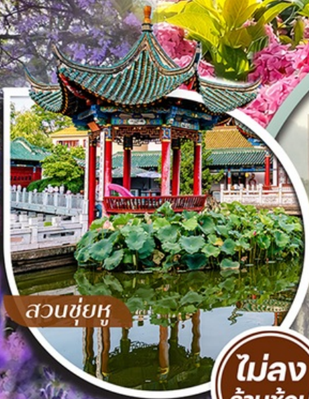
สวนชื่อยู