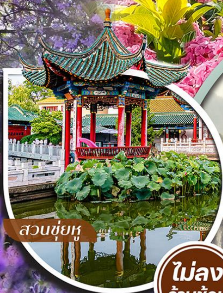
สวนชู้ยู่