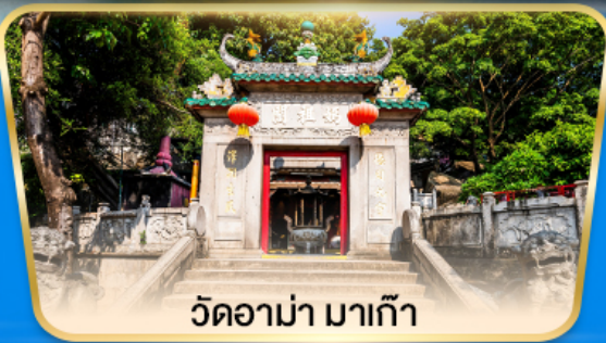
วัดอาม่า มาเก๊า