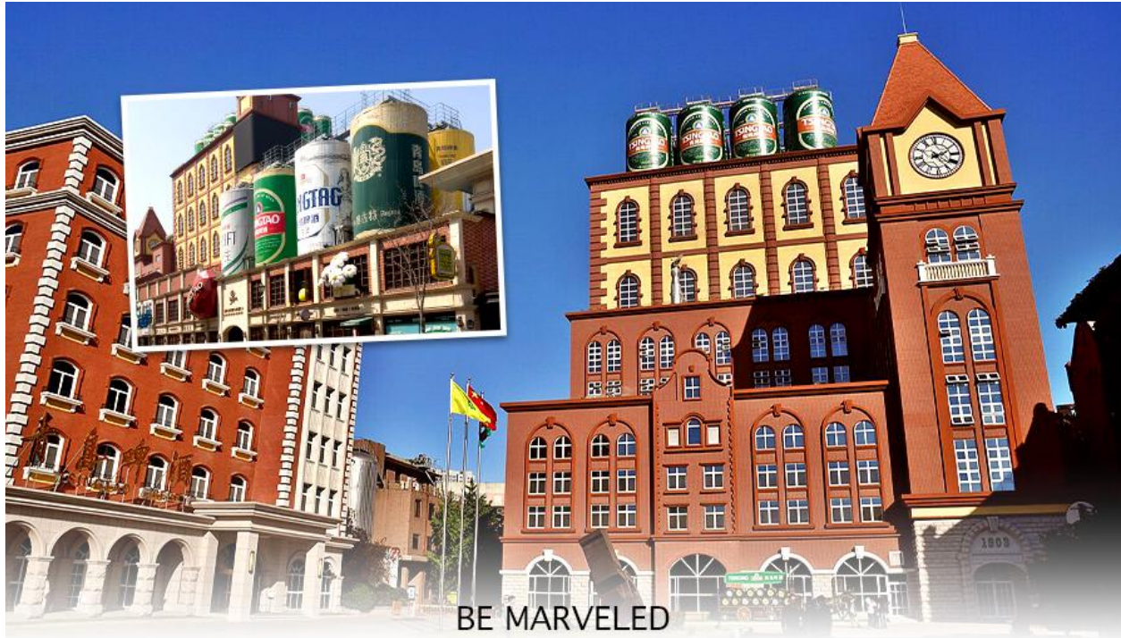
BE MARVELED โรงงานเบียร์ชิงต้า