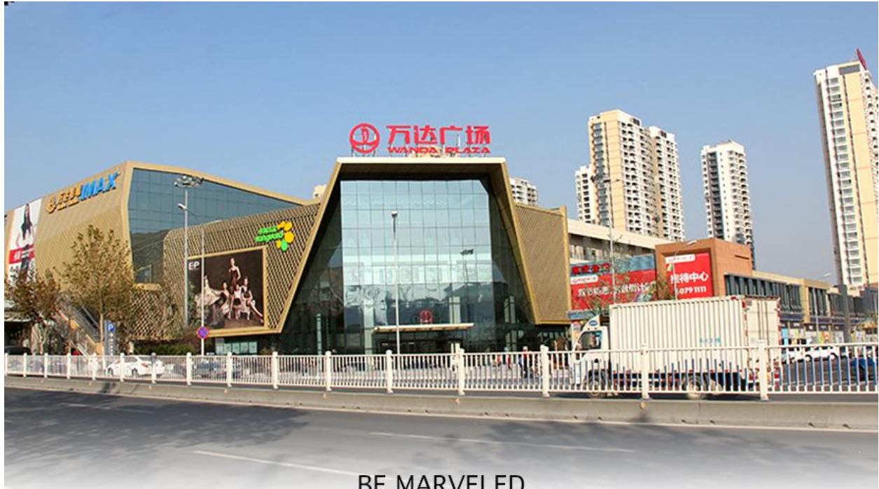
BE MARVELED ช้อปปังศูนย์การค้า (Qingdao Wanda Plaza)

ที่พัก HOLIDAY INN EXPRESS QINDAO หรือเทียบเท่าระดับ 4 ดาว