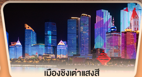
เมืองซิงต้าแสงสี