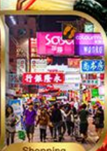
Shopping Tsim Sha Tsui