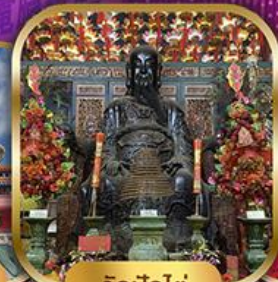
วัดปึกใต้