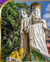
เจ้าแม่กวนอิม สวีลิสเบย์