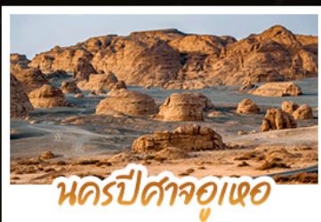
นครปีศาจอู๋เหอ

หนาวนี้ที่ซินเจียง เราจะลิ้มรสความงามสุดอลังการของอุทยานคานาสีอู๋ เก็บภาพสวยครบทุกพิกัด ทั้งศาลาชมปลา อ่าวเสี้ยวจินรา อ่าวซ่งมิงกร และอ่าวเทพทวดคา • นอนพักค้างคืนในกระท่อมไม้ ภายในหมู่บ้านเหมอู่ ตื่นเช้ามาสูดอากาศบริสุทธิ์และจับจุดชมวิวนูบ้านที่ถูกหิมะปกคลุมราวกับเมืองในฝัน นั่งรถไฟขบวนวินคริปัสจู่เหอ • ช้อปปิ้งของฝากที่ตลาดแกรนด์บาซาร์ เมืองอู่ลูบูดี