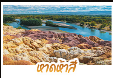
เขาดินห้าสี