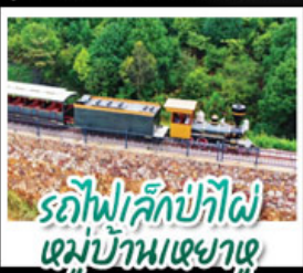
รถไฟเล็กป่าไผ่ หมู่บ้านเหย้าหู