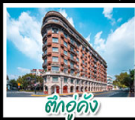
ตึกอู่กิง

หอไข่มุก - เทาหนิวโล่วซาน - วัดพระใหญ่หลิงซานต้าฝอ เรือสำราญ LOUIS VUITTON LV - ตึกอู่กิง รถไฟเล็กป่าไผ่หมู่บ้านเหย้าหู - หมู่บ้านหนียนฮวาวาน