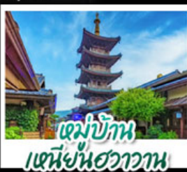
หมู่บ้าน เหมิงหนี่ฮวาวาน