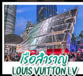
เรือสำราญ LOUIS VUITTON LV