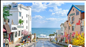
ถนนคอบเพลิงสายที่แปด