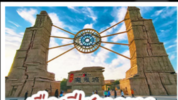
เมืองปีศาจจิ้งจอก