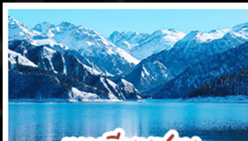
เขาเทียนชาน