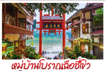
หมู่บ้านโบราณฉือซีโจว