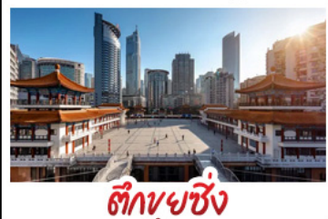
ตึกขุยซิ่ง

พระแกะสลักหินต้าจู้ - หลุมฟ้าสะพานสวรรค์ - เวนางฟ้า ตึกขุยซิ่ง - ตึกตะเกียบ - หมู่บ้านโบราณฉือซีโจว