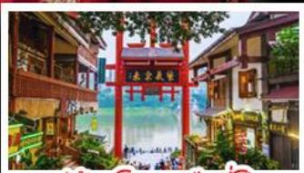
หมู่บ้านโบราณฉือซีโจว