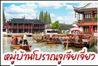
หมู่บ้านโบราณจูเจียงเจี๋ย

สามารถเลือกซื้อ OPTION ได้ 1. เลือกอิสระที่เซี่ยงไฮ้ (เต็มวัน) เที่ยงเองแบบจุกๆ 2. เลือกซื้อ OPTION CITY TOUR (แบบเต็มวัน) รวมอาหารกลางวัน+รถรับส่ง