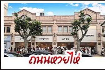
ถนนเซว่ย์ไผ่