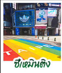
ซีเหมินดิง

สัมผัสเสน่ห์แห่งเกาะฟอร์โมซา • ล่องเรือสุริยันจันทร์รา ทะเลสาบที่สวยงามแห่งหนึ่งของไต้หวัน เกาะลาลู • วัดเหวินอู๋ วัดศักดิ์สิทธิ์ริมทะเลสาบ • สักการะพระอัฐิพระกั๊กซิมจิ้ง • ชิมขนมพายฮับโปรดของฝากยอดเยี่ยม • อนุสรณ์สถานเจียงไคเช็ค แลนด์มาร์กทางประวัติศาสตร์ • ชิเหมินดิง ยำช้อปปิ้งสุดฮิต จิวเฟิ่น หมู่บ้านโบราณโคมแดง บรรยากาศสุดคลาสสิก • ลีอเฟิ่น ปล่อยโคมลอย • ไทเป 101 ตึกระฟ้า สัญลักษณ์แห่งความทันสมัย • จงซาน ย่านคาเฟ่และไลฟ์สไตล์สุดฮิป • วัดหลงซาน วัดเก่าแก่ เสริมสิริมงคล