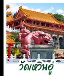
วัดเหวินอู๋