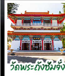
วัดพระกั๊กซิมจิ้ง