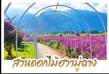
สวนดอกไม้ฮาม่าฉาง