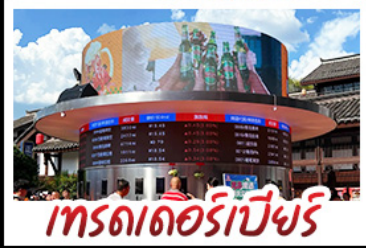
เทรดเดอร์เบียร์