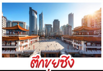
ตึกพุยซิ่ง