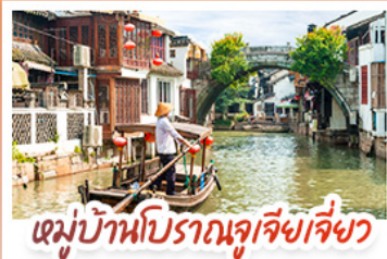
หมู่บ้านโบราณจูเจียงเจี๋ย

สวนสนุกเซี่ยงไฮ้ดิสนีย์แลนด์ เต็มวัน (รวมรถรับ-ส่ง)