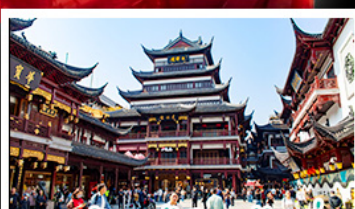
ตลาดร้อยปีเฉิงหวังเหมียว