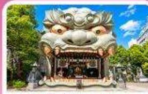
ศาลเจ้านิมมะ ยาชากะ