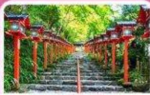
ศาลเจ้าคิฟูเนะ