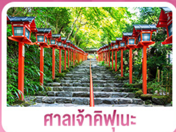
ศาลเจ้าคิฟูเนะ