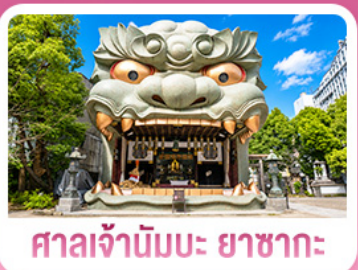
ศาลเจ้านัมบะ ยาชากะ