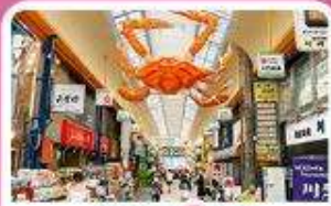
ตลาดคูกูโรง

เดินทาง 03 - 07 ก.ค. 69 | 19 - 23 ส.ค. 69 | 25 - 29 ก.ย. 69