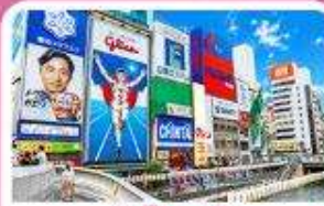
ชินโซนาชิ