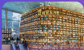
ตึกสมุดสตาร์ฟิลา

เก็บทุกไฮไลท์ ในกรุงโซล ตั้งแต่ความงดงามของ พระราชวังเคียงบ็อก ชมวิวสุดอลังการที่ ดึงลิอเต้ โซลสกาย (รวมค่าลิฟต์ขึ้นดึก) สนุกสุดมันส์ที่ สวนสนุกลิอเต้ เวิร์ล (รวมค่าบัตรเครื่องเล่น) พลิตเพลนไปกับโลกใต้ทะเล ลีอเต้ อควาเรียม (รวมค่าบัตรเข้าชม) เช็กอินแลนด์มาร์กสุดฮิตอย่างห้องสมุดสตาร์ฟิลา โคเอกมอลล์ เดินเล่นย่านฮิป บริกสินกาหลี ซองชุง และช้อปปิ้งซัมเมอร์ชิล สุดฟิน ย่านเมียงดงและฮงแด