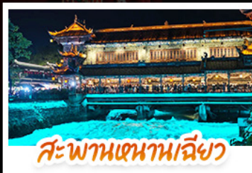
สะพานเจ้านานเฉียว