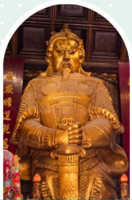
วัดเซกวง

"ไหว้พระ เสริมดวง เพิ่มสิริมงคลแก่ชีวิต"