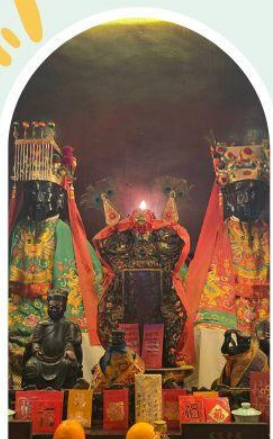
วัดหมิ่นโหมว