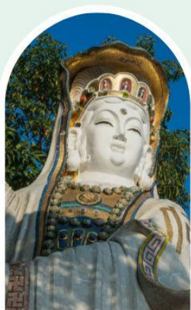
เจ้าแม่กวนอิม ธิพลสัย