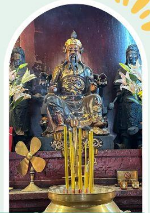
วัดปุกโตฮองฮำ