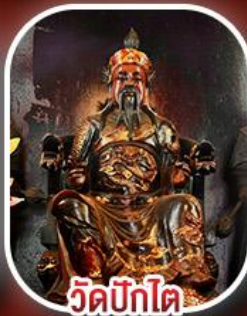
วัดปึกไต้