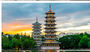
เจดีย์จินเจดีย์ทอง