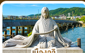
เมืองอูจิ สวรรค์คนรักชาเขียว