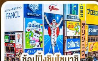
ช้อปปิ้งชินโซบาชิจิ