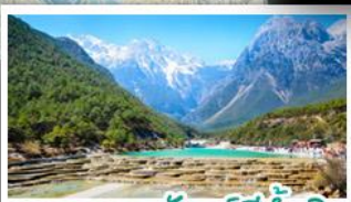
เขตกงเขาพระจันทร์สีน้ำเงิน