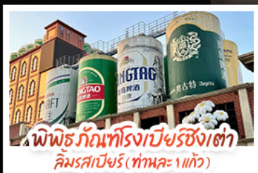
พิพิธภัณฑ์โรงเบียร์ชิงเต่า ลิ้มรสเบียร์ (ทำนอง 1 แก้ว)