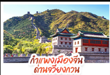
กำแพงเมืองจีน ถ้ำหวงหยก

ล่องเรือสุดโรแมนติกแม่น้ำหวงผู้ ปักกิ่ง..เปิดประตูสู่นมิงกร ด้วยความอลังการระดับจักรพรรดิ ชิงเต่า..เมืองชายทะเลสไตล์ยุโรป หูหราบแบบพ่นคล้าย เซี่ยงไฮ้..มหานครแห่งเอเชีย เมืองที่ไม่เคยหลับไหล