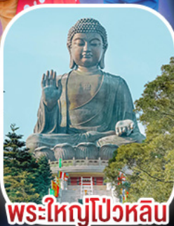
พระใหญ่โป่วหลิน