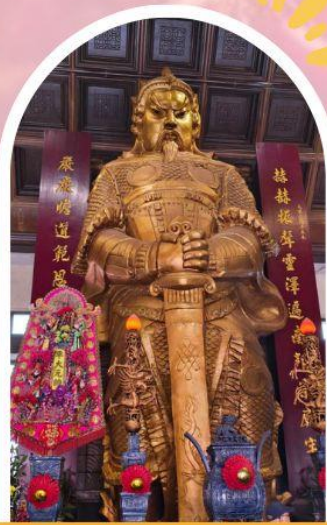
วัดแซกง ขอพรโชคกลาง การเงิน และธุรกิจ