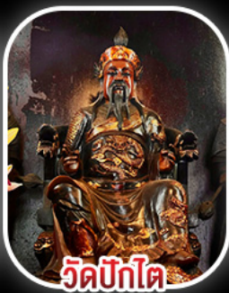
วัดปิกไค