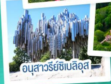
อนุสาวรีย์ซีเบลอุส