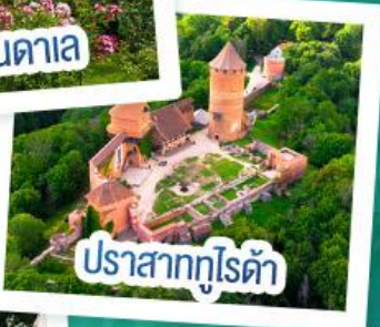
ปราสาทกูไรต้า