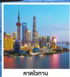
หาดโวกาน