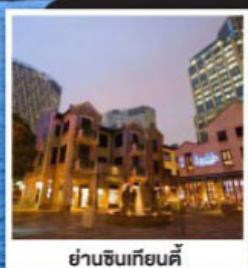
ย่านฉินเทียนตี้