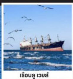
เรือลู่ เว้ยไห่